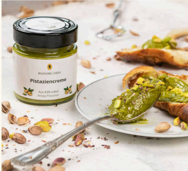
Madame Chéri - Nussaufstrich & Extrakt