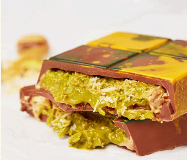
Madame Chéri - Nussaufstrich & Extrakt