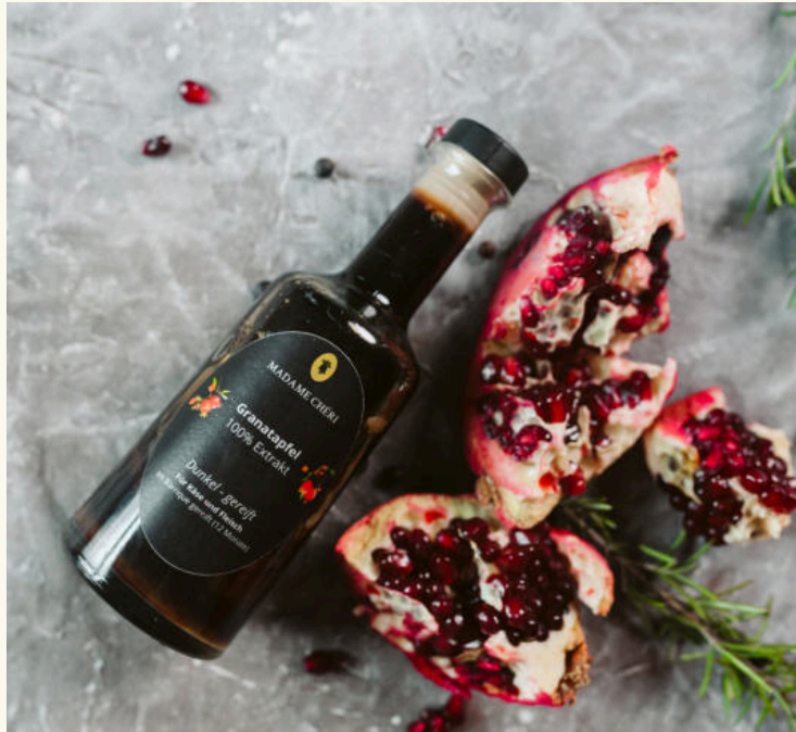
Madame Chéri - Nussaufstrich & Extrakt